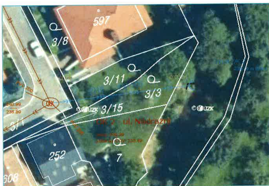
Záměr města 012/2021