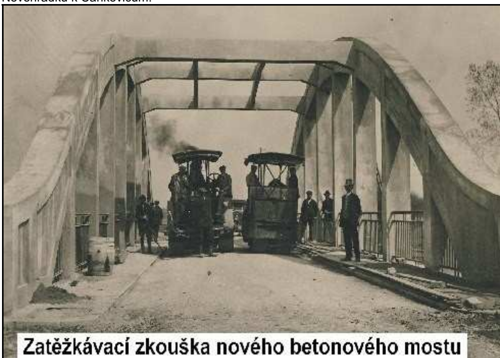
Zatěžkávací zkouška nového betonového mostu

Břeh Ležáku na „Nábřeží“ byl vždy osázen stromy po většině kaštany. Zelen