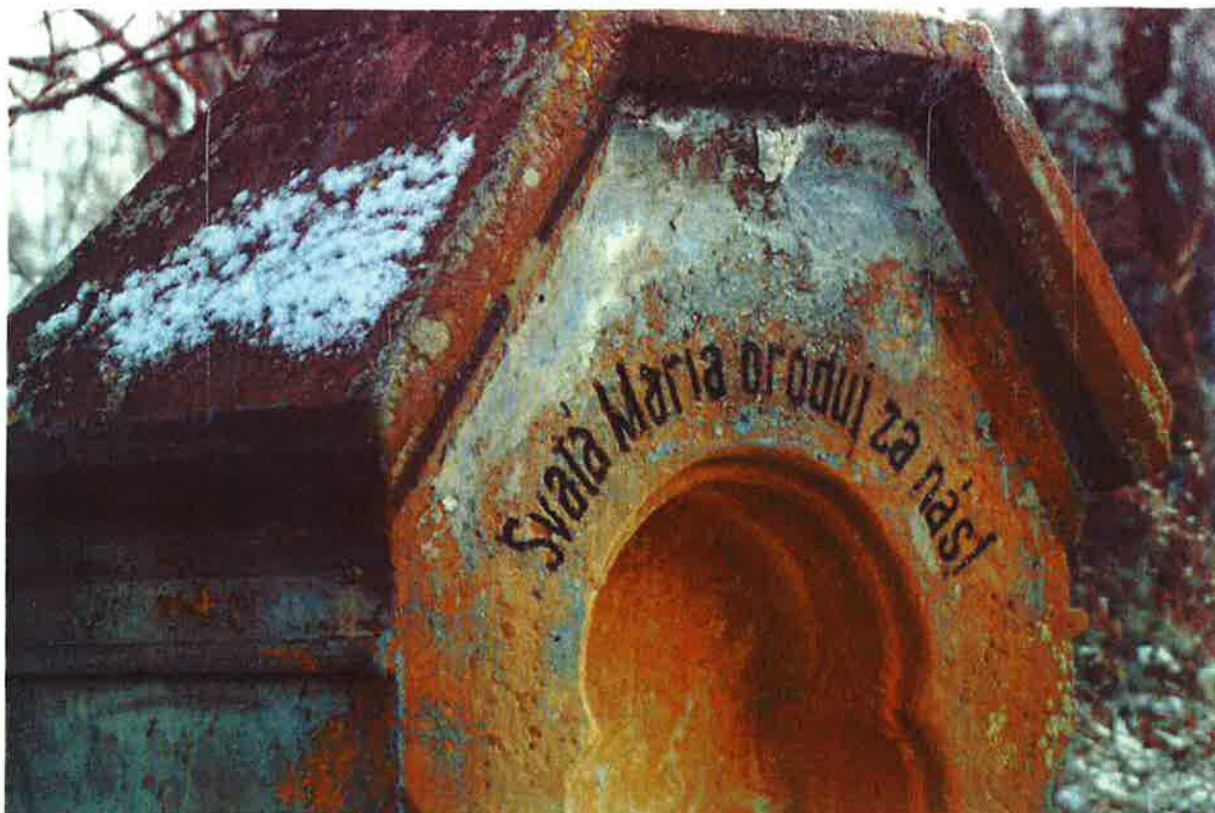
Svatá Maria oroduj za nás

Restaurátorský záměr a rozpočet na restaurátorskou obnovu kamenného památníku Kříž s ukřižovaným Kristem. Hrochův Týnec. 2020