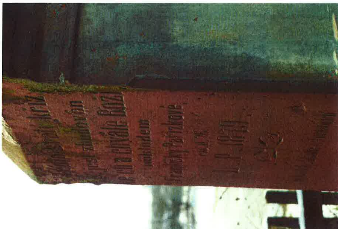
Druhotné nátěry a depozity