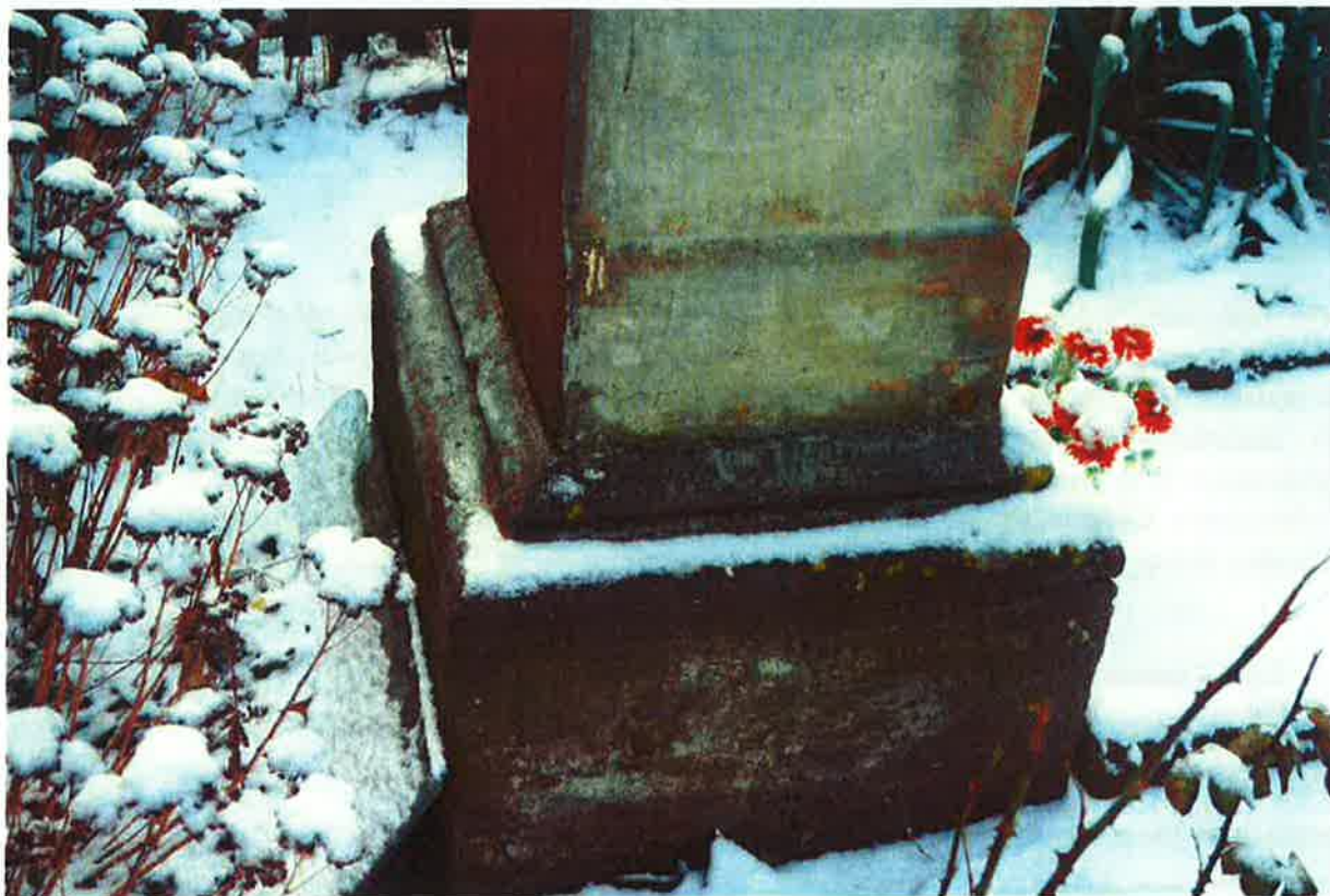
Sokl před restaurováním.